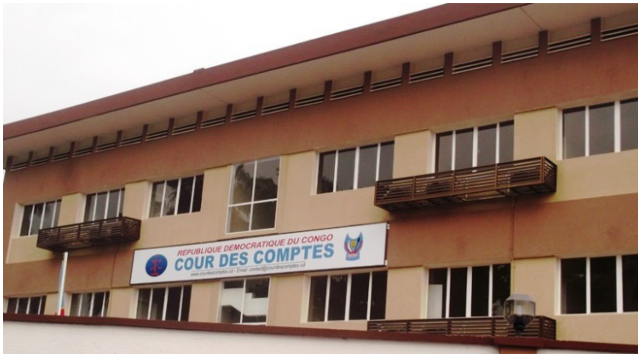
Photo: Immeuble de la Cour des Comptes

E n 2015, l'Observatoire de la Dépense Publique, ODEP en sigle a mis en œuvre le projet « Campagne pour la viabilisation des Institutions Supérieures de contrôle de la gestion des finances publiques en RDC », avec le financement de la fondation sud-africaine OSISA. Ce projet vise à contribuer à la bonne gouvernance et la transparence dans la gestion des finances publiques par les institutions publiques congolaises.