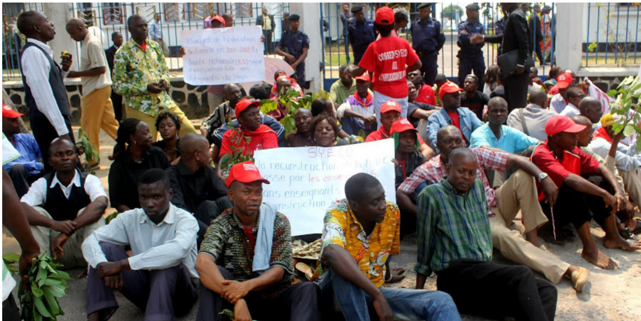
Photo: Setting des enseignants devant le Ministère de l'EPSP

Les crédits alloués au secteur de l'éducation dans le projet de loi de finances 2017, sont évalués à hauteur de 1.005.770.157.592 soit 10,04% de l'enveloppe globale de l'ensemble des dépenses publiques de l'exercice 2017. Comparé au budget 2016, les prévisions du budget de l'éducation ont connu une régression de 114.710.433.398 FC soit de 5% par rapport à 2016 et 83.471.980.151 FC soit 4% par rapport à 2015.