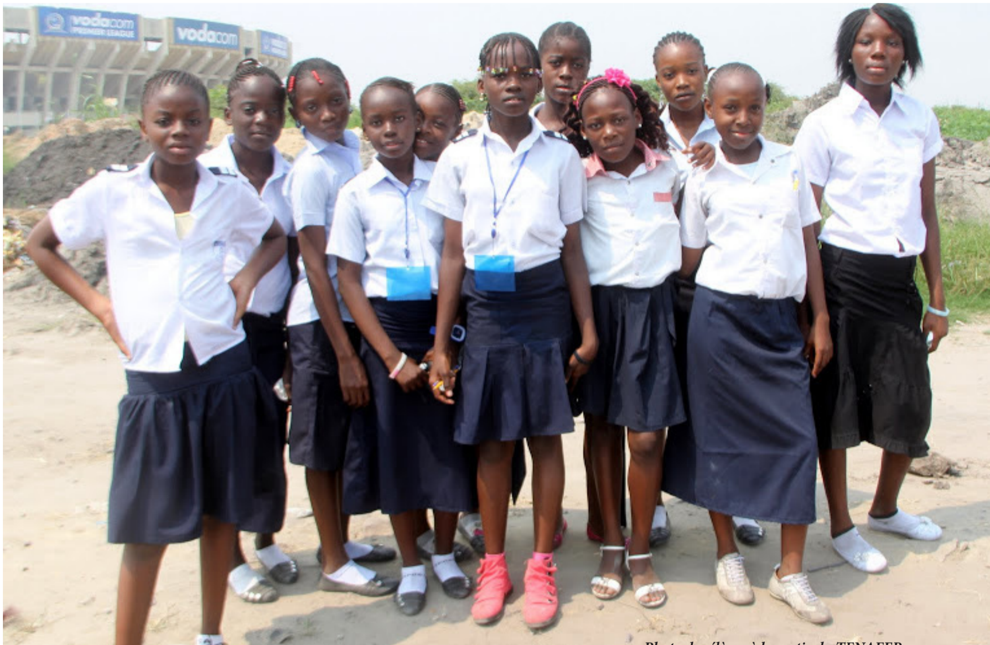
Photo: les élèves à la sortie du TENAFEP

Entre 2017-2019, la politique du gouvernement dans le secteur de l'EPSP vise principalement à assurer la gratuité de l'enseignement de base. Elle consiste aussi à accroître l'accès à l'éducation de base, promouvoir un système éducatif plus équitable, améliorer la qualité et l'efficacité de l'enseignement ainsi qu'à renforcer la gouvernance du secteur.