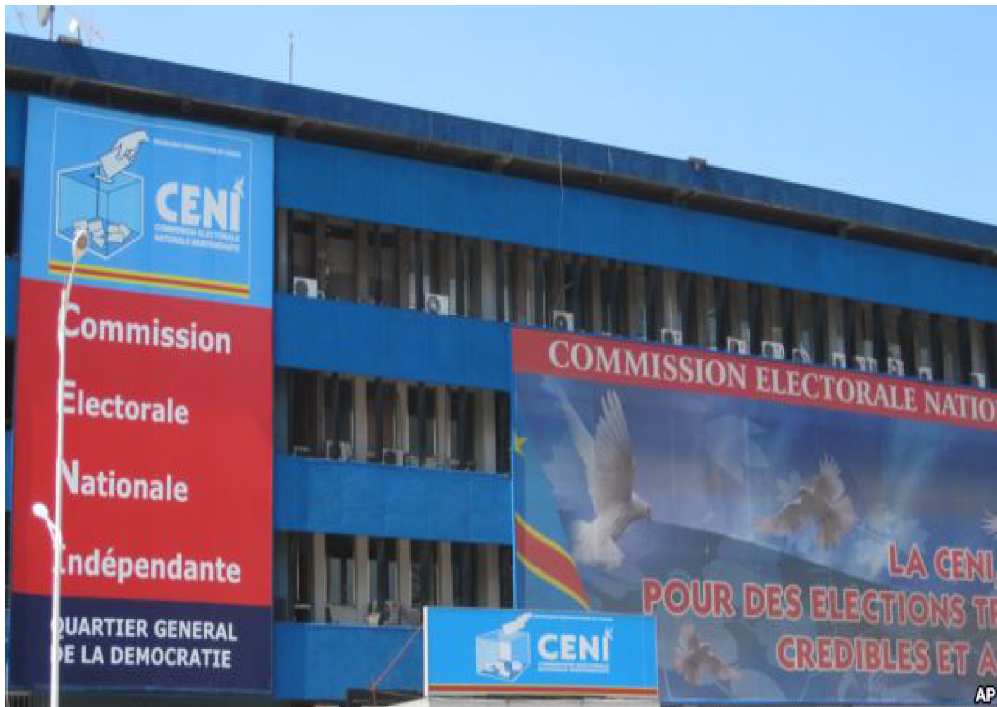
Photo: Siège de la CENI-RDC

cordé plus d'importance aux dépenses de fonctionnement et des interventions économiques.