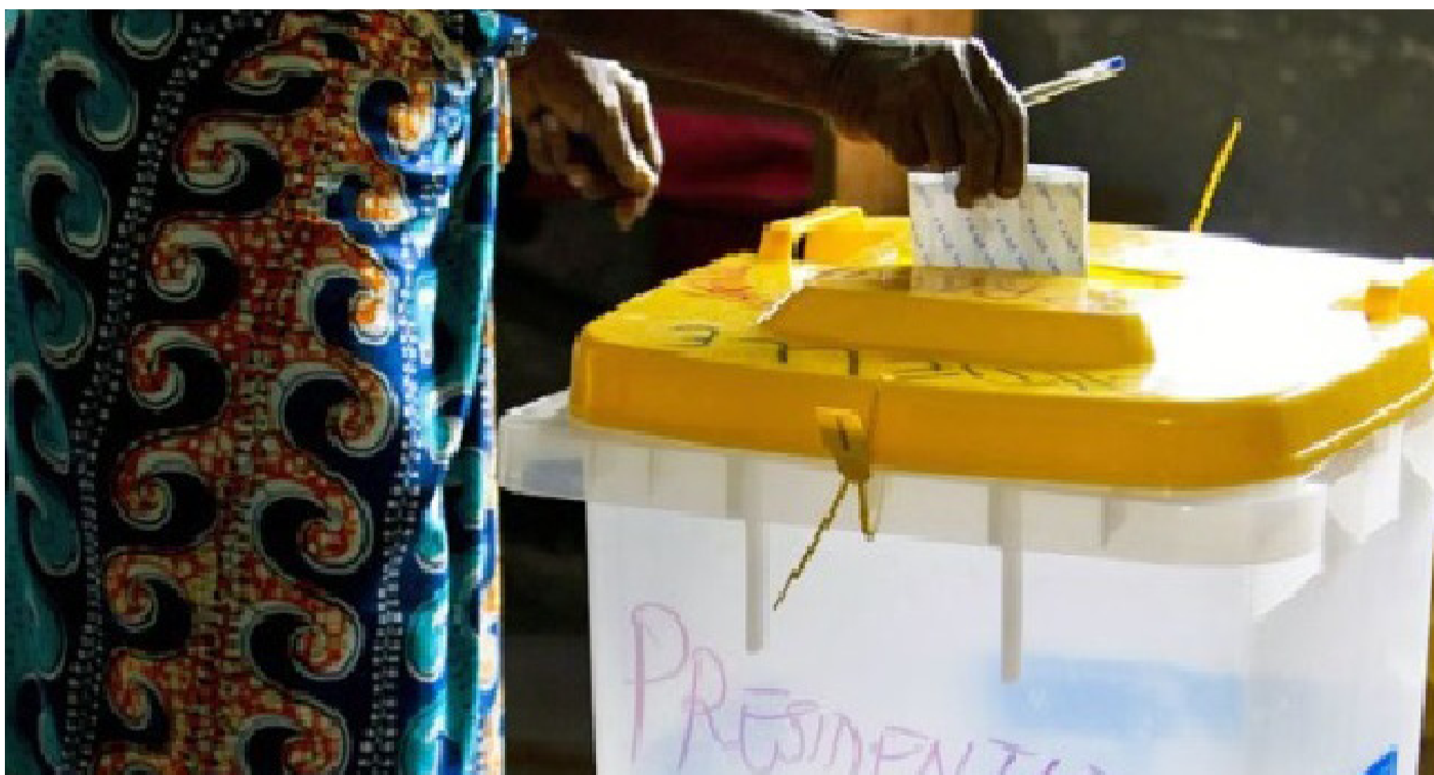
Photo: Un électeur met le bulletin de vote dans l'urne

L' Observatoire de la Dépense Publique , ODEP et la plateforme Agir pour les Elections Transparentes et Apaisées, AETA , deux organisations de la Société Civile travaillant respectivement dans les secteurs de finances publiques et de la gouvernance électorale se sont retrouvées du 9 au 12 juin 2017 à l' AETA pour analyser les prévisions et l'exécution du budget 2016, les crédits provisoires du premier trimestre 2017 et les prévisions budgétaires 2017 alloués à la CENI pour les opérations électorales dans les échéances conclues par l'accord du 31 décembre 2016.